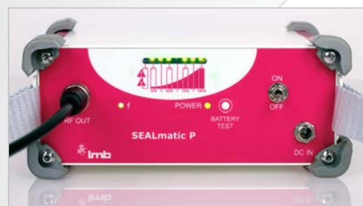
Індикатор статусу запаювання для контролю