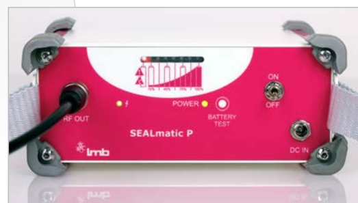
Заряд акумулятора <10% - запаювання заборонено

Офіційний дистриб'ютор в Україні ТОВ «РЕДМЕД»