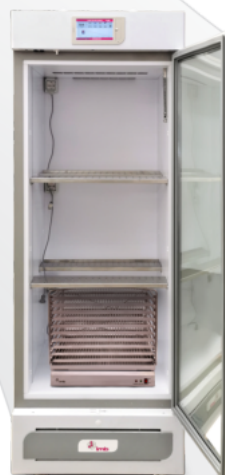
Climax 150 Touch