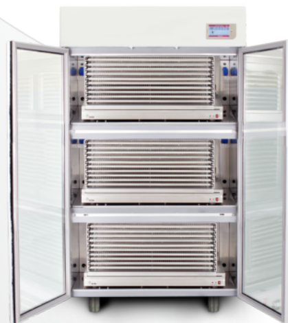
Climax 200 Touch