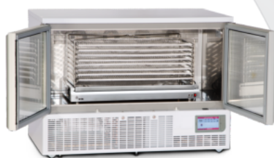
Climax 120 Touch