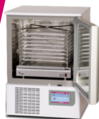
Climax 100 Touch